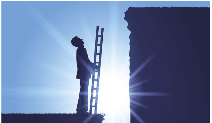
Bei der Beschaffung von Fremdkapital (Darlehen, Bankkredit) kann ein ungeprüfter Abschluss eine Hürde darstellen.

Der Entscheid, auf eine Revision zu verzichten, sollte allerdings nicht allein aufgrund der Kosten erfolgen. Was kurzfristig attraktiv erscheint, kann sich mit dem