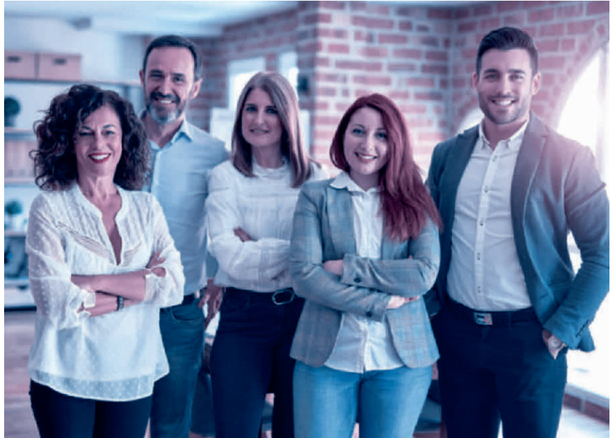
Alles klar: Das Personalreglement schafft eine verbindliche Regelung der Arbeitsbeziehung.

Grundlegender Bestandteil des Personalreglements ist das Arbeitszeitmodell des Unternehmens. Also beispielsweise die gleitende Arbeitszeit mit definierten Blockzeiten, Regelungen zum Homeoffice und die im Betrieb übliche Wochenar-